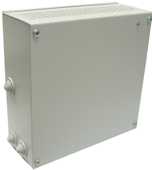
Abb. 1 Akkugepuffertes Netzgerät Genius im Kompaktgehäuse